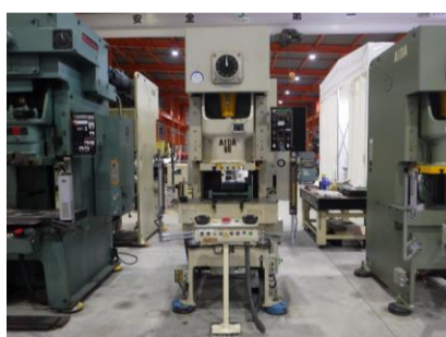
C型プレス アイダ NC1-60(1) 1996年製 60t ストローク長さ90 管理番号:H018288 置場:マシンプラザ本庄