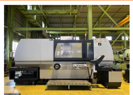
平面研削盤 岡本工作 PSG-84CA 2012年製 チャックサイズ'800×400 管理番号:H018198 置場:マシンプラザ本庄