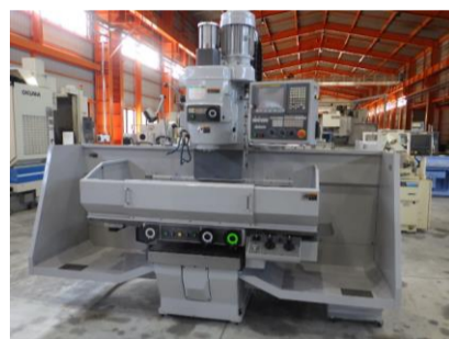
NC立フライス 山崎技研 YZ-350NCR 2019年製 FANUC32i-B BT50 管理番号:H018468 置場:マシンプラザ本庄