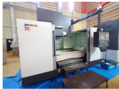
立型マシニングセンター OKK MILLAC-611V II 2015年製 OSP-300M BT50 管理番号:P008601 置場:東日本マシンプラザ