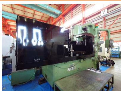
NCロータリー研削盤 市川 ICB-1500NC 2002年製 チャックサイズ'φ1400 管理番号:P007869 置場:東日本マシンプラザ