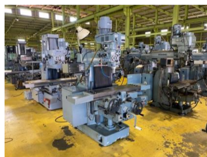
ラム型フライス 静岡鐵工所 VHR-SD 1991年製 NT40 テーブルサイズ1100×280 管理番号:H018521 置場:マシンプラザ本庄