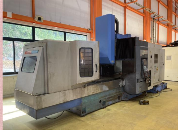
門型マシニングセンター ヤマザキマザック FJV35/80 2000年製 MAZATROL 640M BT50 ATC40本 管理番号:H017620 置場:マシンプラザ本庄 ¥6,500,000 → ¥5,200,000