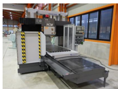
門型NCフライス 山崎技研 YZ-1121 2015年製 BT50 テーブルサイズ2000×920 管理番号:H018205 置場:マシンプラザ本庄