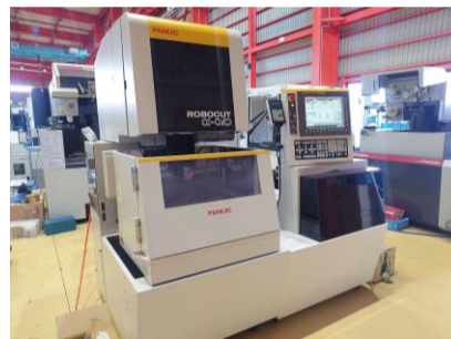
NCワイヤーカット ファナック α-0iD 2007年製 310is-WA 管理番号:P008674 置場:東日本マシンプラザ