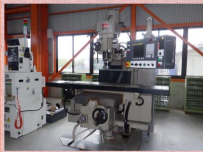
NC立フライス 遠州 SEV-B 1998年製 FANUCOi-Mate MD NT40 管理番号:H017660 置場:マシンプラザ本庄