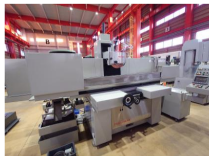
NC平面研削盤 岡本工作 PSG105EXB 2001年製 OKAMOTO PRECISION(FANUC) 管理番号:P008264 置場:東日本マシンプラザ