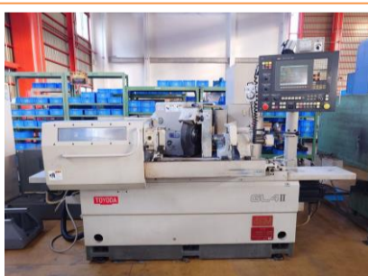
NCアンギュラ円筒研削盤 豊田工機 GL4A-50 II 2002年製 GC32 テーブル上の振り320 管理番号:P008266 置場:東日本マシンプラザ