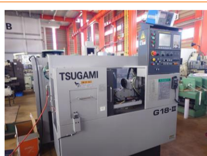
NC円筒研削盤 ツガミ G18-II AB 2012年製 FANUC0i-TD テーブル上の振り180 管理番号:P008545 置場:東日本マシンプラザ