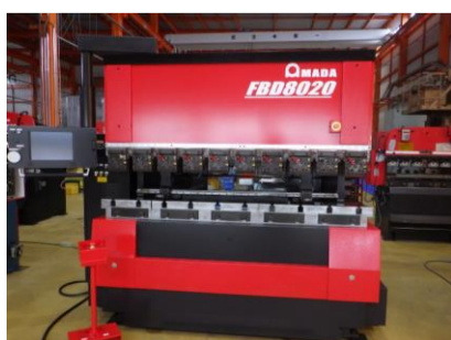
NCベンダー アマダ FBD8020NT 2001年製 80t テーブル長さ2000 管理番号:H018490 置場:マシンプラザ本庄