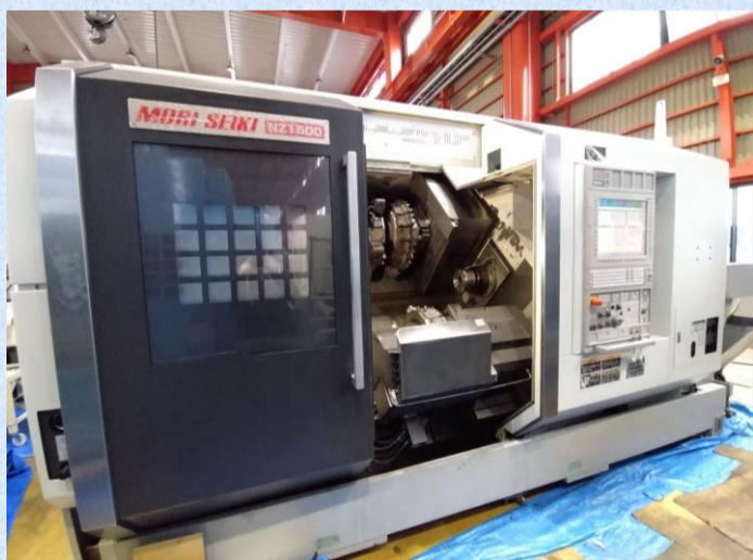
複合NC旋盤 森精機 NZX1500/800STY2 2012年製 FANUC31iA メインサブ共に6寸3爪チャック 管理番号:P007822 置場:東日本マシンプラザ ¥15,000,000 → ¥8,500,000