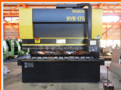
NCパンダー 東洋工機 HYB-17530 2004年製 175t テーブル長さ3000 ストローク長さ2000 管理番号:H016940 置場:マシンプラザ本庄