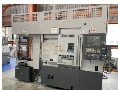
複合NC旋盤 オークマ LB2000EX 2011年製 OSP-P200LA 6吋3爪チャック 管理番号:H017646 置場:マシンプラザ本庄