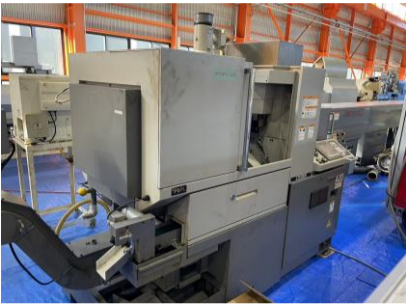
NC自動盤 シチズン A20VIPL 2006年製 FANUC ローターガイドブッシュ 管理番号:H018392 置場:マシンプラザ本庄