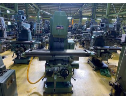
ひざ型フライス 大隈豊和 STM-2V 1989年製 NT50 テーブルサイズ1500×310 管理番号:H017366 置場:マシンプラザ本庄