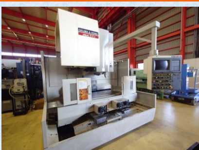
立型マシニングセンター 大隈豊和 MILLAC-511V 1996年製 OH-OSP-HMC BT50 管理番号:P008352 置場:東日本マシンプラザ