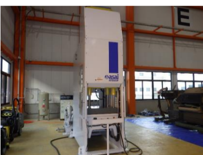
油圧プレス アサイ HFB100P 2009年製 30~100t ストローク長さ300 管理番号:H017002 置場:マシンプラザ本庄