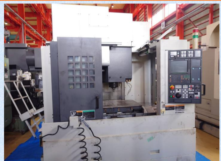
立型マシニングセンター 森精機 NV5000 α 1A/40 2007年製 MSX-501 III (FANUC) BT40 ATC30本 管理番号:P008635 置場:東日本マシンプラザ ¥7,800,000 → ¥7,000,000