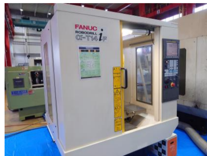
ドリリングセンター ファナック α-T14iF 2007年製 FANUC31i-A BT30 管理番号:P008596 置場:東日本マシンプラザ