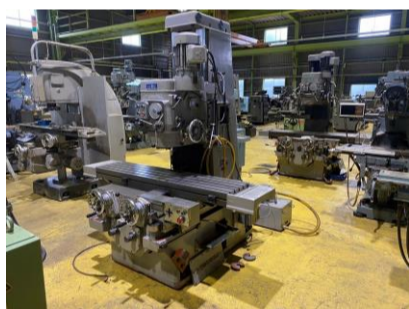
ペット型フライス 山崎技研 YZ-8C 1997年製 NT50 テーブルサイズ1500×350 管理番号:H017731 置場:マシンプラザ本庄