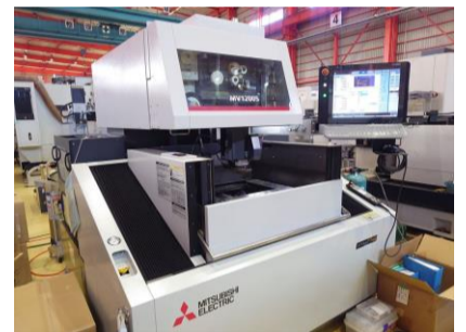
NCワイヤーカット 三菱電機 MV1200S 2019年製 D-CUBES テーブルサイズ'650×540 管理番号:P008631 置場:東日本マシンプラザ