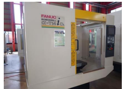
ドリリングセンター ファナック α-T14iDL 2003年製 FANUC16i-MB BT30 ATC14本 管理番号:P008560 置場:東日本マシンプラザ