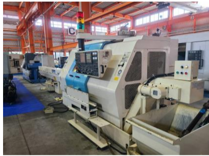
NC自動盤 中村留 TW-10MM 2000年製 FANUC18i-T(対話機能付き) 管理番号:H018517 置場:マシンプラザ本庄