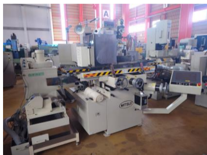
NC平面研削盤 三井ハイテック MSG-618PC-NC 2007年製 チャックサイズ'350×150 管理番号:P008397 置場:東日本マシンプラザ