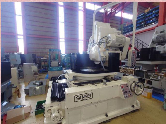
横軸ロータリー研削盤 三正 GK-8 チャック径800φ スローク:上下555 左右550 管理番号:P008403 置場:東日本マシンプラザ