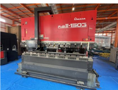
NCベンダー アマダ FBD1503NT 2001年製 150t テーブル長さ3000 管理番号:H018699 置場:マシンプラザ本庄