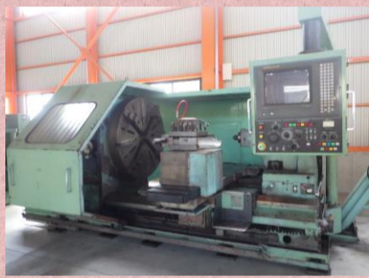
フラット型NC旋盤 中部工機 FNS130×125 2001年製 FANUC15-T φ1200.4爪単動チャック 管理番号:P006881 置場:マシンプラザ本庄