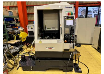
立型マシニングセンター 碌々産業 NANO-21 2006年製 FANUC-31i-A5 HSK-E25 管理番号:P008457 置場:東日本マシンプラザ