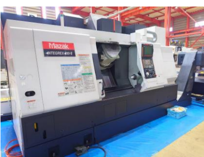
複合NC旋盤 ヤマザキマザック INTEGREX200-III 2004年製 MAZATROL640MT 8吋中実チャック 管理番号:P008516 置場:東日本マシンプラザ