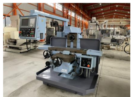
NC横フライス 岩下 NH2 2008年製 FANUC 0i-MC NT50 管理番号:H018007 置場:マシンプラザ本庄