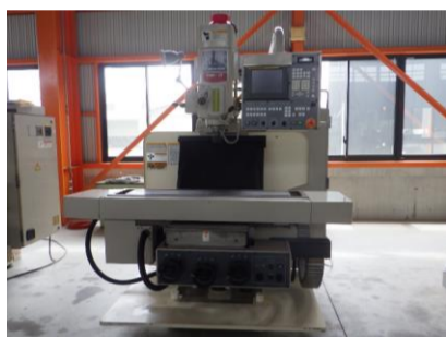
NC立フライス 大隈豊和 FMR-30 2000年製 FANUC20i-F NT40 管理番号:H018530 置場:マシンプラザ本庄