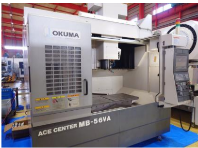
立型マシニングセンター オークマ MB-56VA 2007年製 OSP-P200M BT40 管理番号:P008606 置場:東日本マシンプラザ