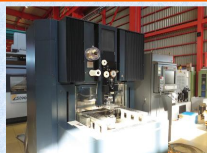
NCワイヤーカット 牧野フライス製作所 U53i 2005年製 MGW-S III テーブルサイズ*780 × 560 管理番号:P008048 置場:東日本マシンプラザ