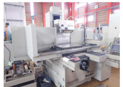
NC平面研削盤 岡本工作 PSG-65EXB 2005年製 チャックサイズ'600×500 管理番号:P008163 置場:東日本マシンプラザ