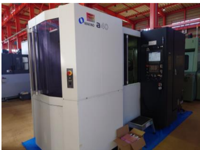
横型マシニングセンター 牧野フライス a40C2 2018年製 Professional5 BT40 管理番号:P008548 置場:東日本マシンプラザ