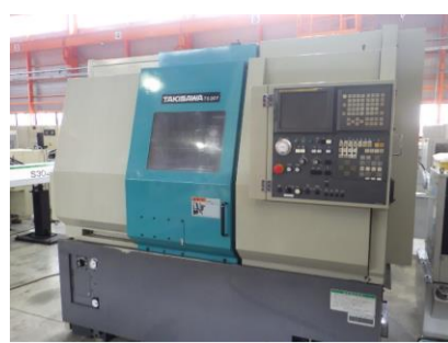
複合NC旋盤 滝沢 TS-20Y 2001年製 FANUC21i-T 8吋3爪チャック 管理番号:H018343 置場:マシンプラザ本庄