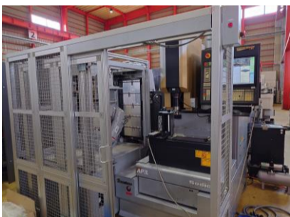
NC放電加工機 ソディック AP1L 2007年製 LQ1 ATC60本 テーブルサイズ'360× 管理番号:P007709 置場:東日本マシンプラザ