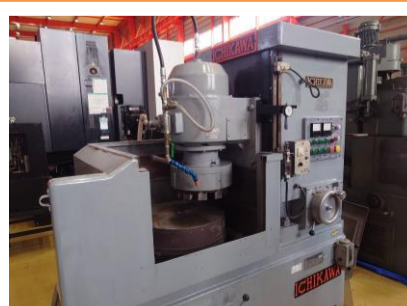
ロータリー研削盤 市川 ICB-603 1989年製 チャックサイズ'φ500 管理番号:P008537 置場:東日本マシンプラザ