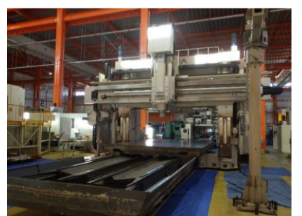
五面加工機 オークマ MCR-B II 35×50 2004年製 OSP-E100M BBT50 管理番号:H015701 置場:マシンプラザ本庄