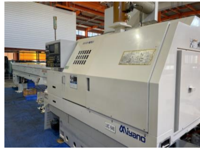
NC自動盤 ミヤノ BNE-51S 1998年製 FANUC18-T 管理番号:H017837 置場:マシンプラザ本庄