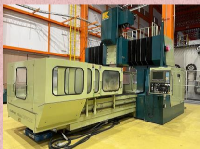
門型マシニングセンター 倉敷機械 KMV-130Z 1994年製 FANUC-15M BT50 ATC90本 管理番号:H018018 置場:マシンプラザ本庄