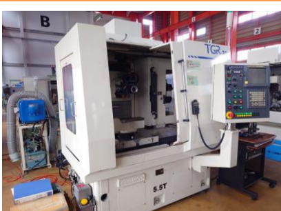
NC工具研削盤 宇都宮 TGR-200 2008年製 FANUC16i-MB 主軸回転数 管理番号:P008565 置場:東日本マシンプラザ