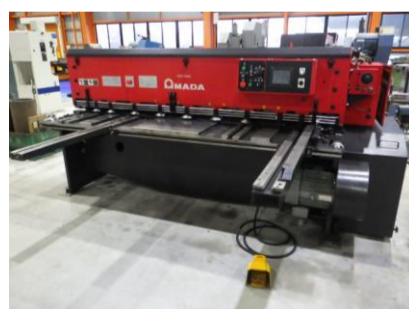
シャーリング アマダ M2060 1990年製 6.0×2000 マグネットサポート 管理番号:H018406 置場:マシンプラザ本庄