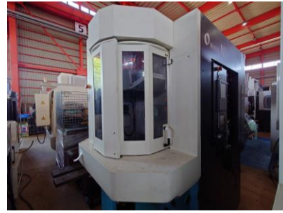
横型マシニングセンター 牧野フライス N2 2014年製 Professional F HSK-A40 管理番号:P008199 置場:東日本マシンプラザ