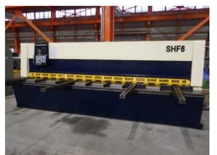
シャーリング コマツ SHF6×410 1989年製 6.5×4100 オートパッケージ付 管理番号:H017409 置場:マシンプラザ本庄