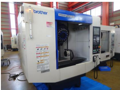
タッピングセンター ブラザー S700X1 2015年製 CNC-C00 BT30 ATC14本 管理番号:P008613 置場:東日本マシンプラザ