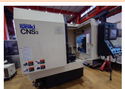
NC工具研削盤 牧野フライス CNS3 2005年製 FANUC 最大工具シャック径φ12.7 管理番号:P008417 置場:東日本マシンプラザ