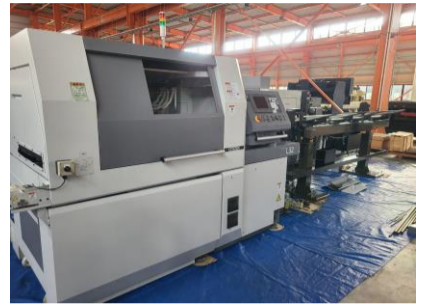
NC自動盤 シチズン L32 1M8 2015年製 MELDAS ローターガイドブッシュ 管理番号:H018586 置場:マシンプラザ本庄