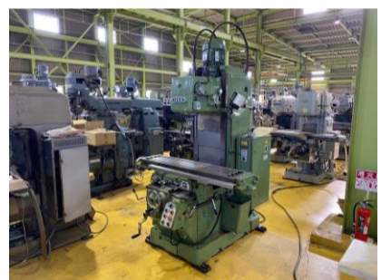
ペット型フライス OKK MH-2V 1989年製 NT50 テーブルサイズ1310×300 管理番号:H017283 置場:マシンプラザ本庄