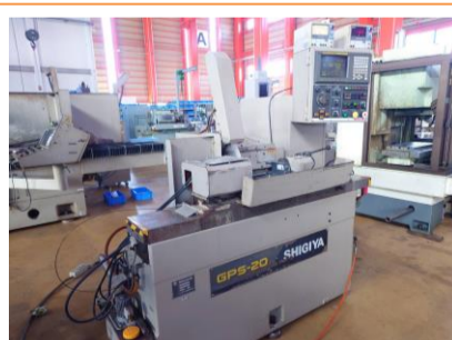
NC円筒研削盤 シギヤ精機 GPS-20.50 1999年製 FANUC POWER MATE 管理番号:P008265 置場:東日本マシンプラザ