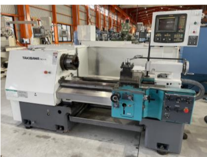
簡易型NCフライス 滝沢 TAC-510 2001年製 FANUC20T 9吋3爪スクロールチャック 管理番号:H018405 置場:マシンプラザ本庄