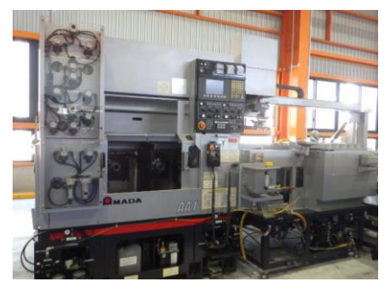
複合NC旋盤 アマダ AA-1 2012年製 FANUC31i-A 平行2スピンドル 管理番号:H017865 置場:マシンプラザ本庄