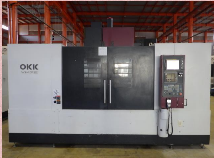
立型マシニングセンター OKK VM7 III 2004年製 FANUC180is-MB BT40 管理番号:H017375 置場:マシンプラザ本庄 ¥8,000,000 → ¥6,400,000